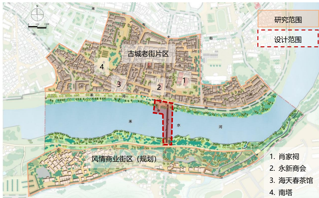
竞赛设计范围与周边空间规划图