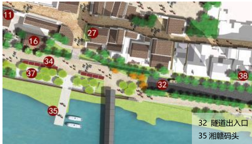
图 1. 拟设计文星桥、码头及规划隧道出入口平面关系图