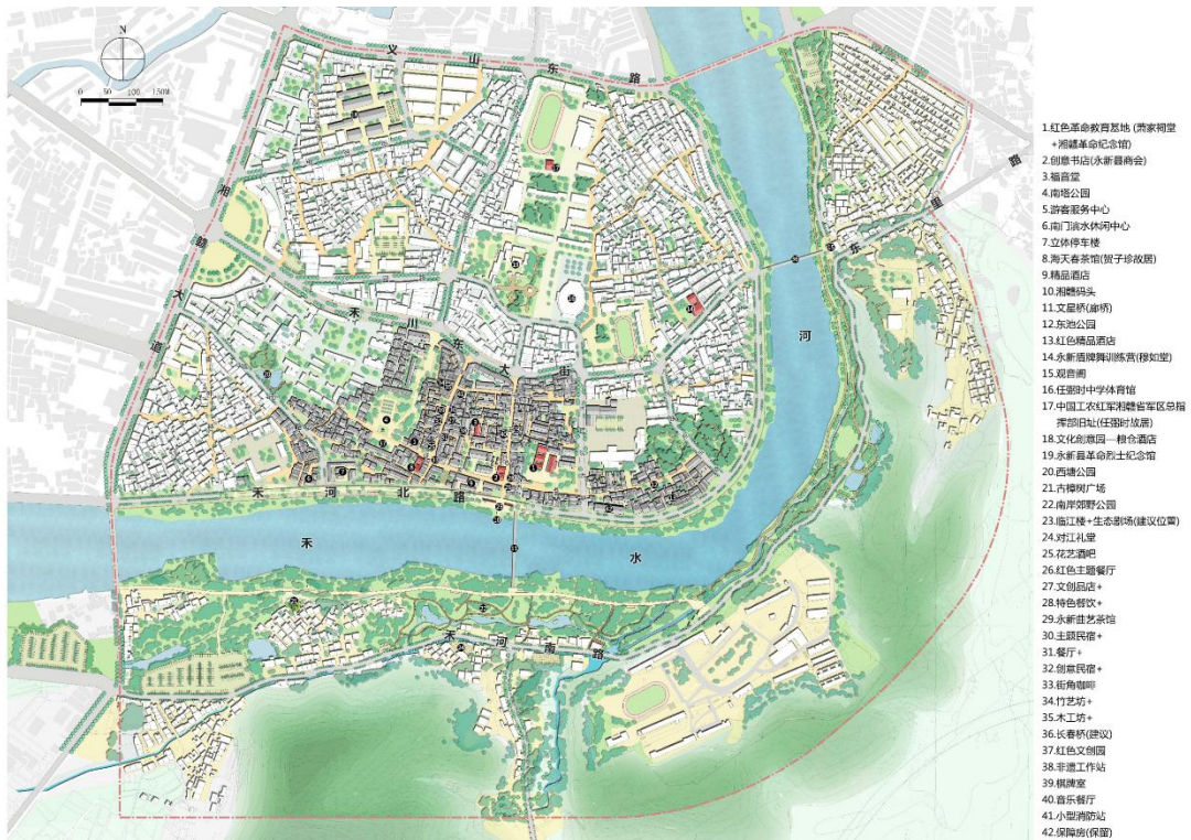
永新空间规划网络图

在此背景下，永新县人民政府与CBC共同发起了“重见永新”古城再生计划，以永新古城风貌与文化为基底，以设计、文化、艺术的引领，通过事件、社群、产业为古城赋能，展开了永新古城实操解困、面向未来的更新改造。至此，中国规划大师杨保军领衔的规划团队，和景观大师王向荣领衔的景观团队已经对古城进行了深入的研究，通过规划设计进行了优化和升级。